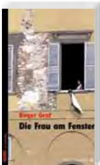
Roger Graf Die Frau am Fenster

Krimi Stauffers erster Fall 2. Auflage 416 Seiten, PB Euro 12,90 13,30 (A) /sFr 18,90 978-3-86532-995-0 WG 2121 Lieferbar