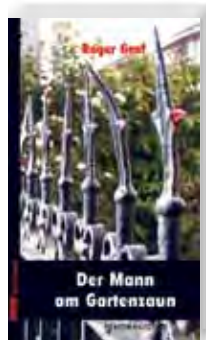
Roger Graf Der Mann am Gartenzaun

Krimi Stauffers erster Fall 2. Auflage 416 Seiten, PB Euro 12,90 13,30 (A) /sFr 18,90 978-3-86532-995-0 WG 2121 Lieferbar